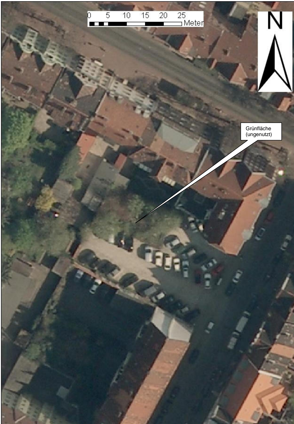
Luftbild vom Grundstück Velberstraße 4 (Bildflug 1. 4. 2010)

Quelle: Auszug aus den Geobasisdaten der Niedersächsischen Vermessungs- und Katasterverwaltung, © 2012 Landesamt für Geoinformation und Landentwicklung Niedersachsen (LGLN)